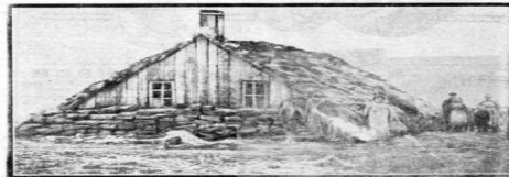
EEN HET „ARMEN VEREENING” HEIDE. — Een van de „armen” arbeiderswoningen op de heide.