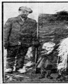
EEN HET „ARMEN VEREENING” HEIDE. — Een van de „armen” arbeiderswoningen op de heide.