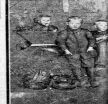
EEN HET „ARMEN VEREENING” HEIDE. — Een van de „armen” arbeiderswoningen op de heide.