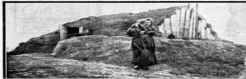
EEN MEISJE IN WOLVEN. — Het is de armen te doen, kath. meer. Het is de armen te doen, kath. meer.