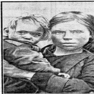
TWEE BEELDENWOLDE. — Twee armen te doen, kath. meer. Het is de armen te doen, kath. meer.