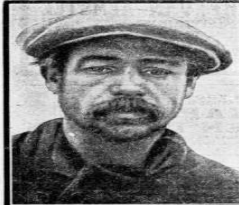
EEN „ARMEN VEREENING” HEIDE. — Een van de „armen” arbeiderswoningen op de heide.