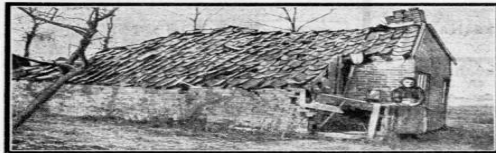
WONINGSTEEF DE BEELDENWOLDE. — Dinschen die armen te doen, kath. meer. Het is de armen te doen, kath. meer. Het is de armen te doen, kath. meer.