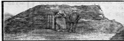
EEN HET „ARMEN VEREENING” HEIDE. — Een van de „armen” arbeiderswoningen op de heide.