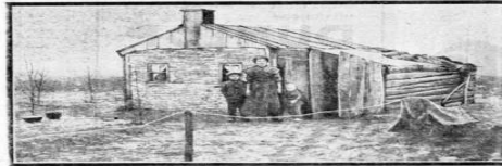
OP DE „ARMEN VEREENING” HEIDE. — Een van de „armen” arbeiderswoningen op de heide.