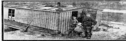
EEN HET „ARMEN VEREENING” HEIDE. — Een van de „armen” arbeiderswoningen op de heide.