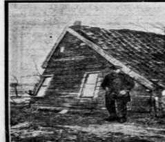
EEN HET „ARMEN VEREENING” HEIDE. — Een van de „armen” arbeiderswoningen op de heide.